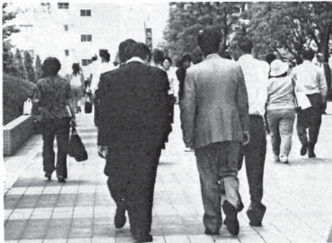
PET診断で見た脳の画像