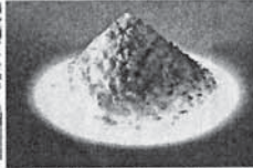
期待がかかるフェルラ酸

このフェルラ酸は、現 在、認知症専門医など9名の医療機関で臨床データがとられており、中では混乱が見られ、3個描きなおしているが1回で正常文字を描いたという。また、昨年8月からアラセプト5mgを飲んでいた80歳の女性は、長女が死んでアルツハイマー病が悪化。今年4月から「フェルガード100」(60包・6300円)を取材協力(株式会社グロービア)から取り寄せて、7月20日に来院、開口一