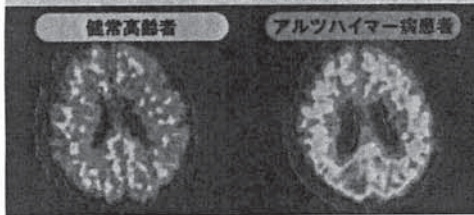
アルツハイマー病は脳にすぎ間が多い (週刊ダイヤモンドより)

このフェルラ酸は、現 在、認知症専門医など9名の医療機関で臨床データがとられており、中では混乱が見られ、3個描きなおしているが1回で正常文字を描いたという。また、昨年8月からアラセプト5mgを飲んでいた80歳の女性は、長女が死んでアルツハイマー病が悪化。今年4月から「フェルガード100」(60包・6300円)を取材協力(株式会社グロービア)から取り寄せて、7月20日に来院、開口一