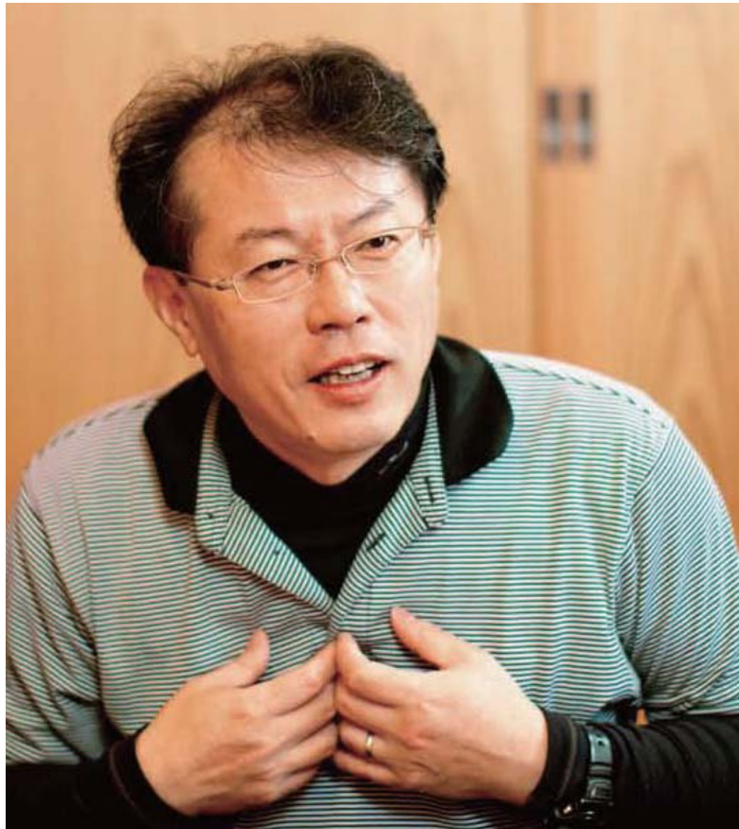
医療法人社団KARIYAまいんずたわーメンタルクリニック院長