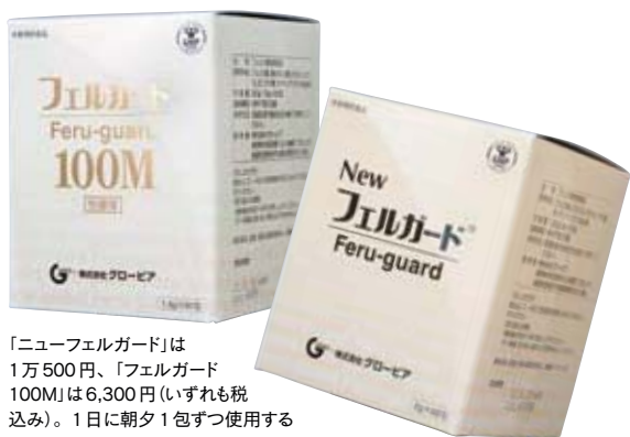
「ニューフェルガード」は1万500円、「フェルガード100M」は6,300円（いずれも税込み）。1日に朝夕1包ずつ使用する