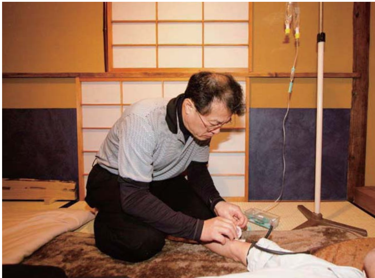
茶室で患者に点滴をする。茶室は床の間を備えた本格的なもので、仮院長の妻がお茶を点てることも