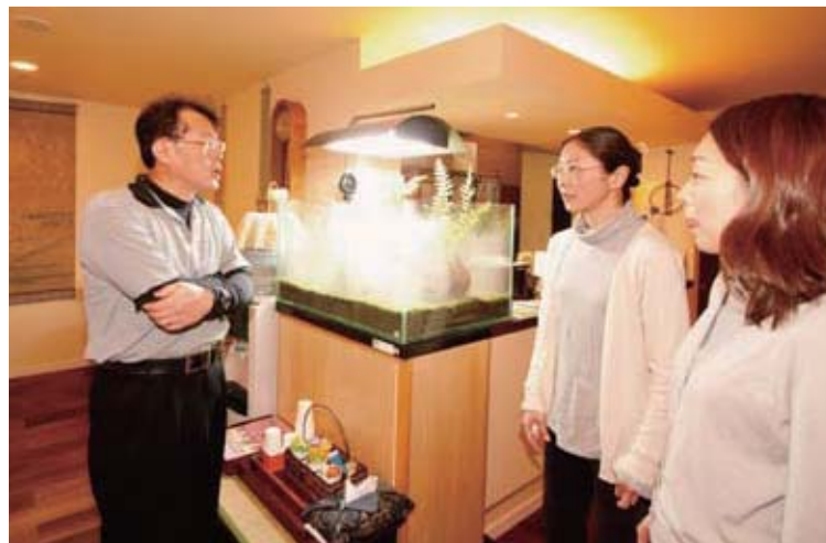
待合室でスタッフとミーティング。蒸気の出る水槽は患者の癒しになる

■所在地 東京都渋谷区代々木2-1-1 新宿マインズタワー B1 TEL : 03-5302-5288 URL : http://www.mmc-mcc.com/mmc/index.html ■診療科目 精神科、内科