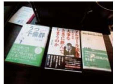
うつやアルコール依存症をテーマにした書籍でも、新しい精神科医療のスタイルを発信する