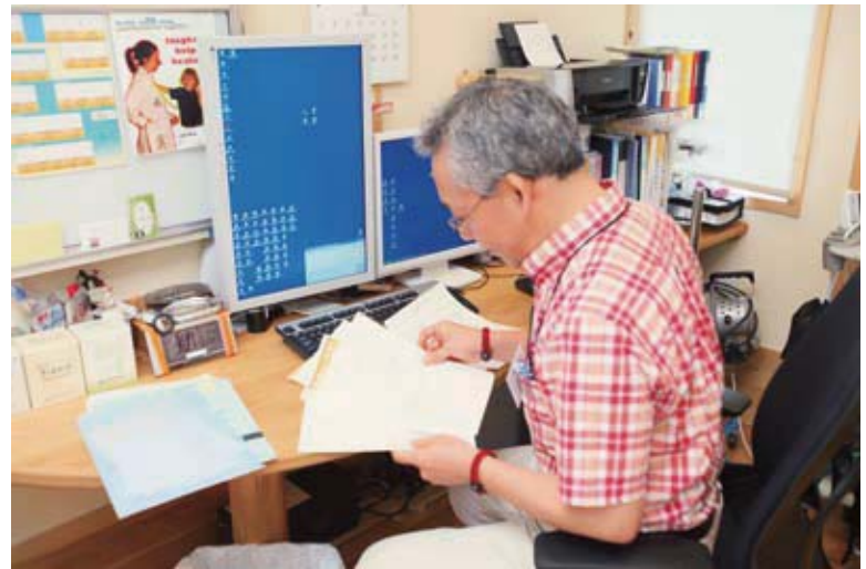
1日の終わりには介護者やケアマネジャーからのメールやFAXに目を通し、どんな些細な報告も必ずチェック