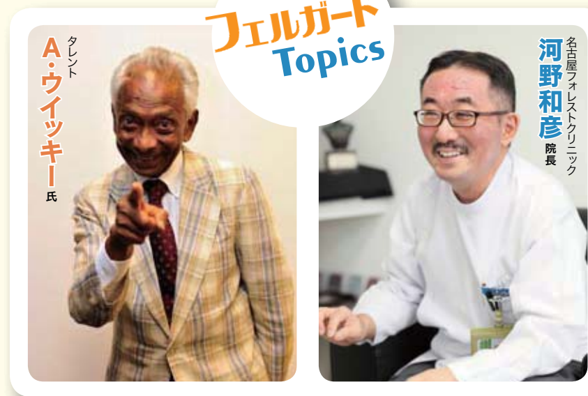
タレント A・ウィッキー氏