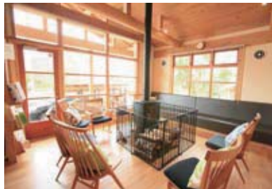
“癒し”をコンセプトにしたログハウス調の佇まい。冬場は待合スペースの暖炉を囲んで皆と語り合う