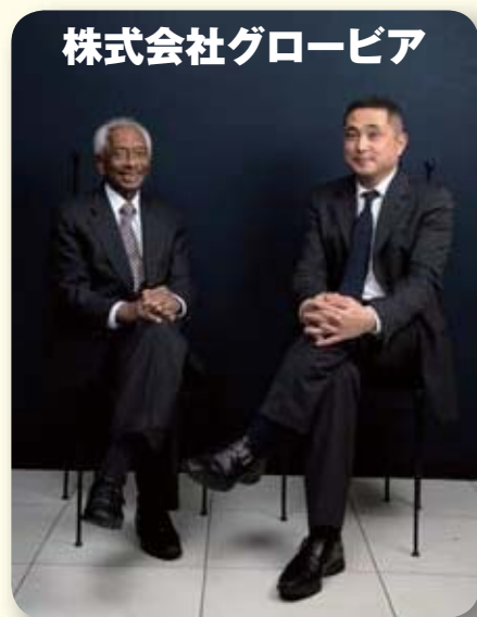
株式会社グロービア