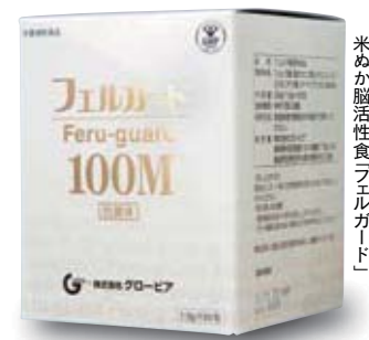
←ウィッキー氏が愛用する 米ぬか脳活性食「フェルガード」

そのとおりです。私の場合、家族が不調に気づいてくれたことから早期の受診につながりました。その時に、親身に相談に乗ってくれて適切なアドバイスを送ってくれる、「信頼できる医師」と出会えたことが、不安に解消につながっています。認知症かもしれないと意識した時に、すぐに行動すること、信頼できる医師を見つけることの大切さをつくづく実感しました。「認知症かもしれない」と不安を抱えている方はたくさんいると思います。認知症に詳しい、信頼できる医師が少しでも増えたらいいですね。