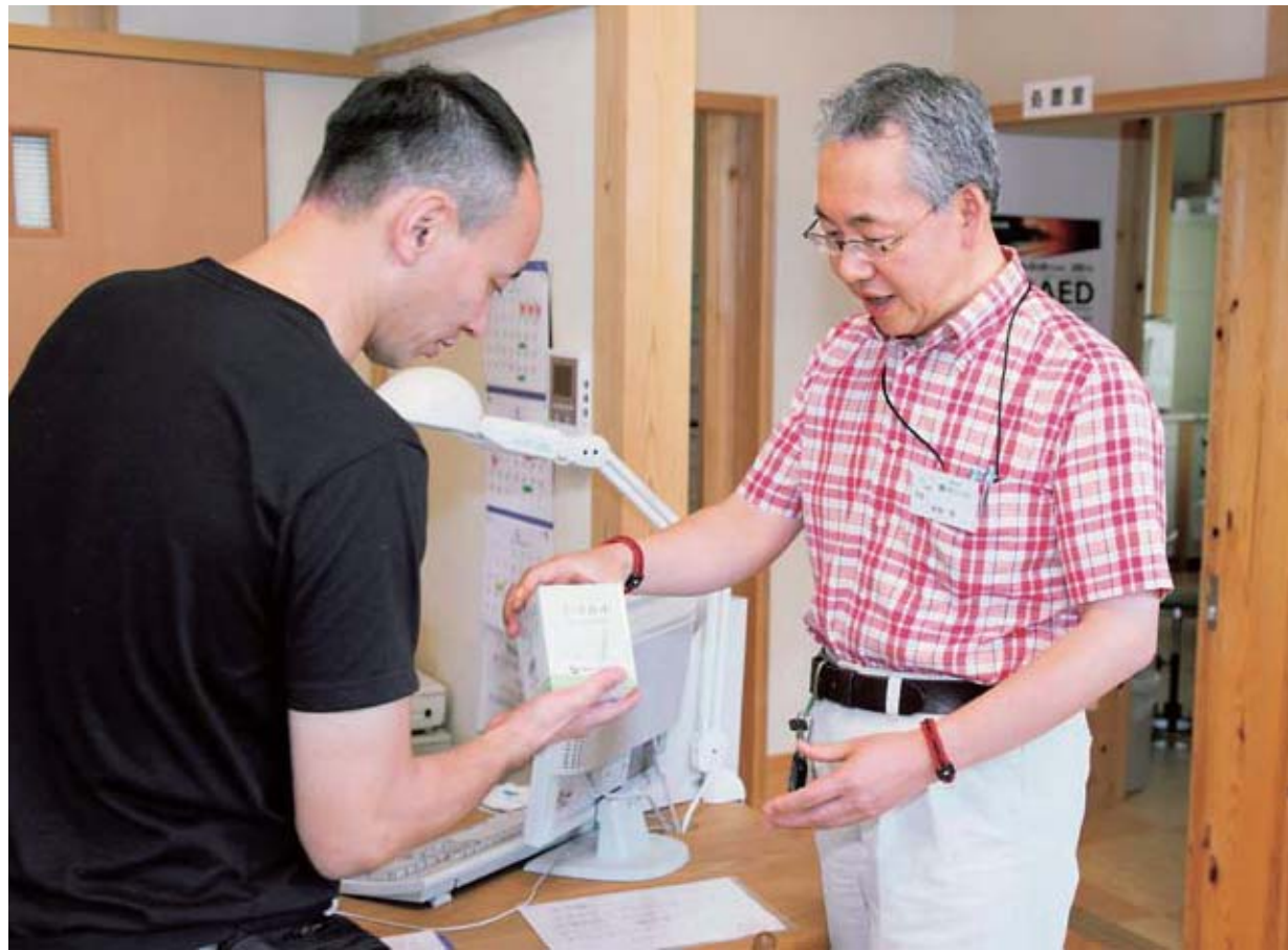
家族や施設職員ら付き添いの介護者に、患者の症状や処方せんについて説明しながらコミュニケーションを図る