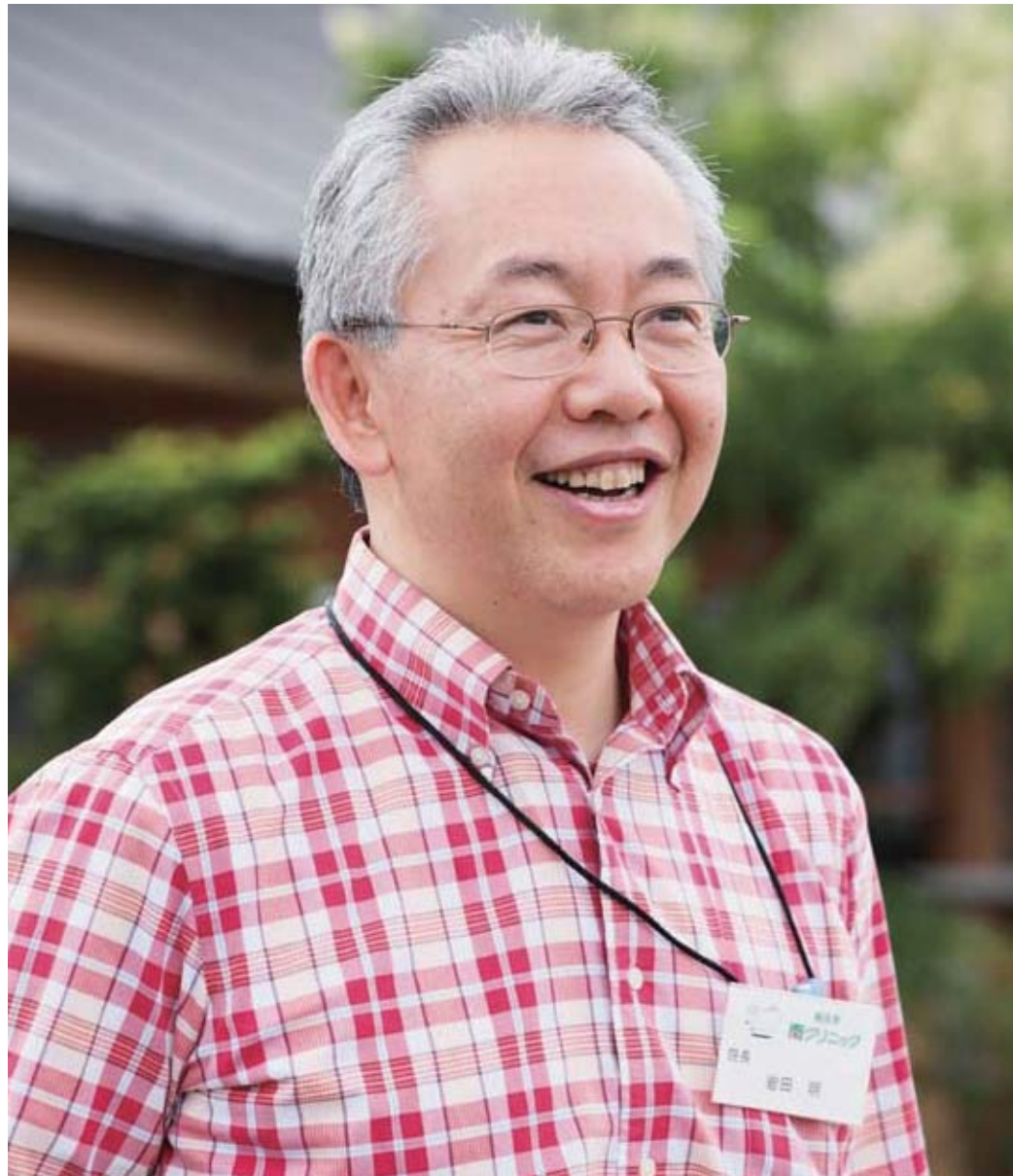
長久手南クリニック院長