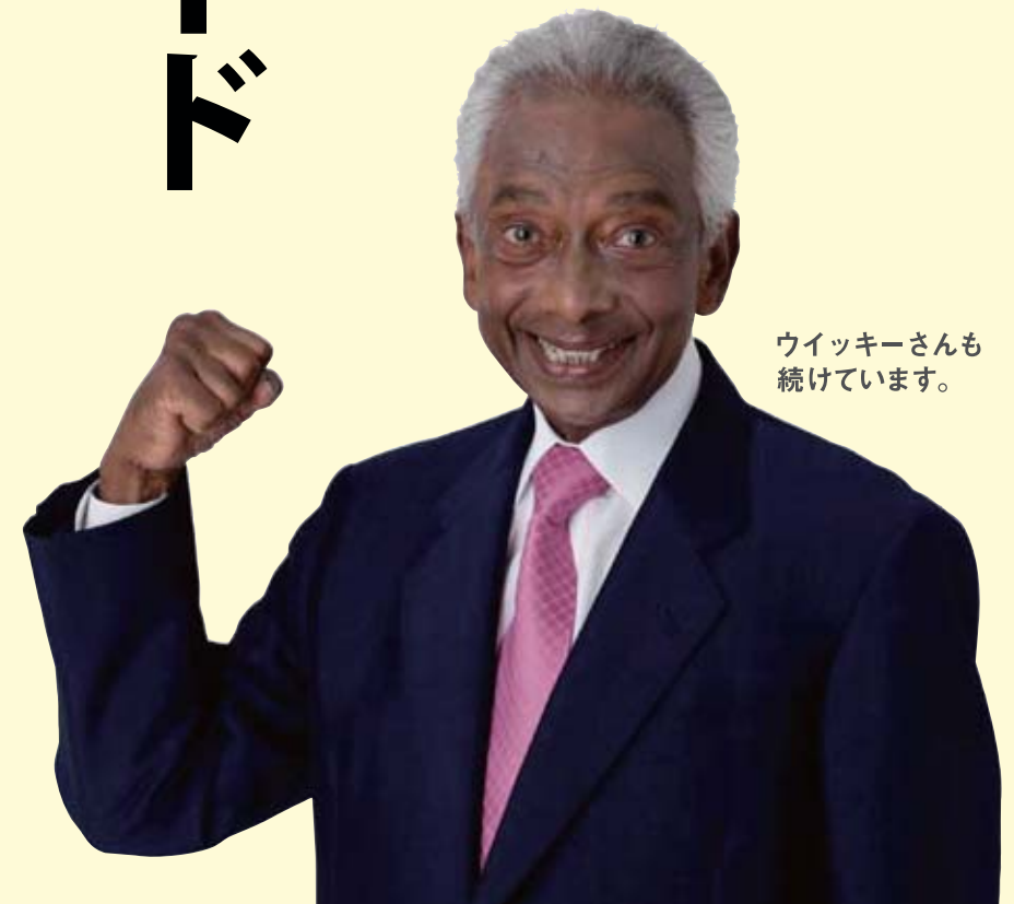
ウィッキーさんも 続けています。