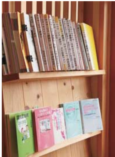
尊敬する河野和彦医師の著書や臨床データを待合スペースに備え、認知症の正しい知識を啓発