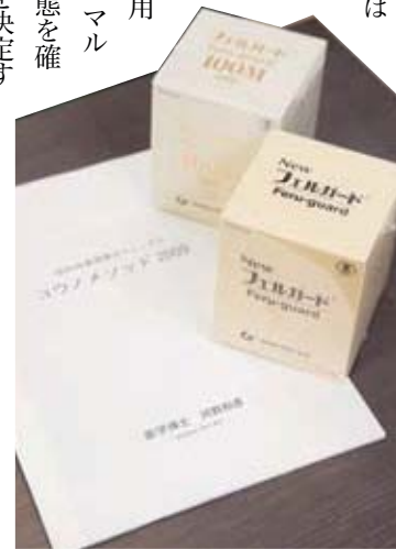
米ぬか由来のサプリメント「フェルガード」を併用した、独自の認知症薬物療法「コウノメソッド」で治療

また、同院は「安らぎ・信頼・希望」をモットーに、介護に疲れた患者・家族を癒しのアメニティーで迎え、河野院長が自信に満ちた笑顔で迎える。診療以外にも、全国各地で